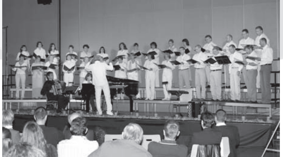
Ob bunt oder ganz in weiss, ein Ohren- und Augenschmaus auf alle Fälle.

Nicht weniger laut und trotzdem eine Art Balsam für die Ohren: Die Spider Murphy Gang, eine bayrische Mundartband, welche mit Ihrem «Skandal im Sperrbezirk» sogar in Brasilien und Japan Kultstatus erlangte und dann vor allem die Klostertaler am Samstag, drückten dem 2. Alpen-Power-Pur ihren Stempel auf. Mit Rock n Roll und schönen Balladen sorgten diese und andere Bands für eine grandiose Partystimmung. Zudem konnte das Publikum am Wochenende vom 8.–10. September 2006, den Klostertalern in Turtmann zu ihrem 30. Geburtstag gratulieren!