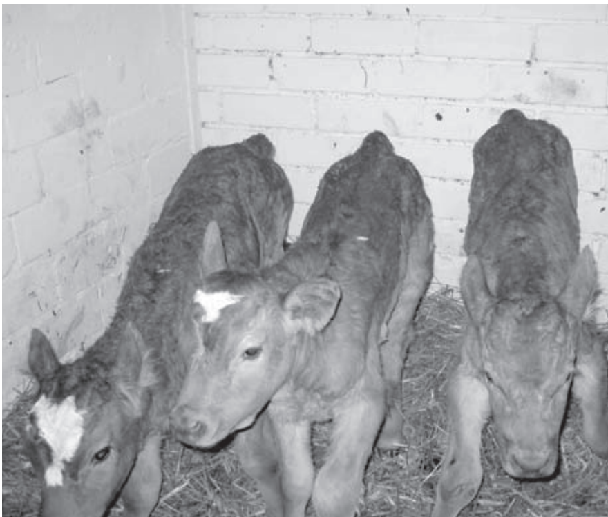
Drillinge auf vier Beinen!

Text: Hans Schnyder