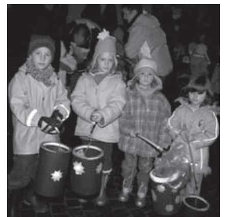
wiär geh mit ischär Latärnu ...