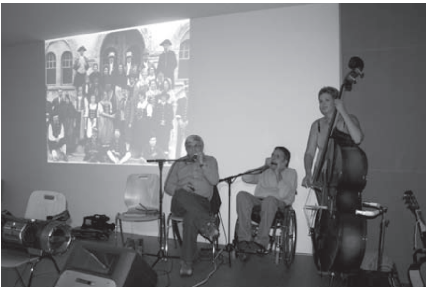
Musikalische Unterhaltung auf Turtmänner Art

eing.) Trotz schlechter Witterung konnte der traditionelle St. Martinsumzug durchgeführt werden. Die Kindergärtner erhielten dieses Jahr Unterstützung durch jüngere Laterenträger. So wurden eigens für diesen Anlass im Kindergarten und im Kreis junger Mütter Laternen gebastelt. Für die meisten Kinder ist mit St. Martin auch die weihnachtliche Vorbereitungszeit angebrochen.