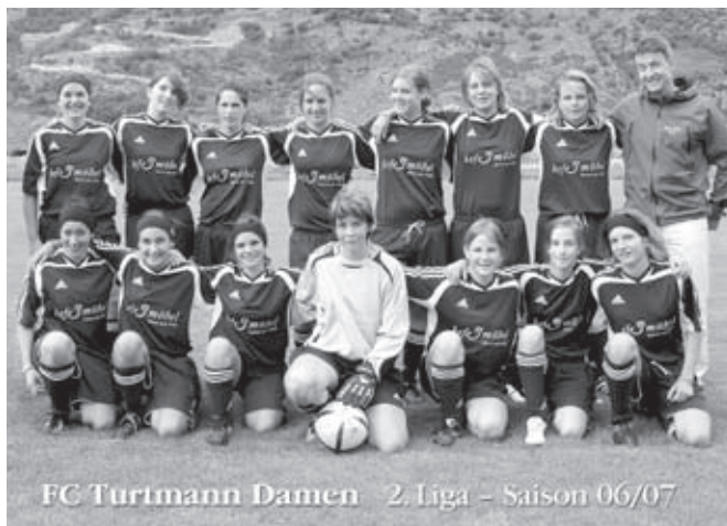
FC Turtmann Damen 2. Liga - Saison 06/07